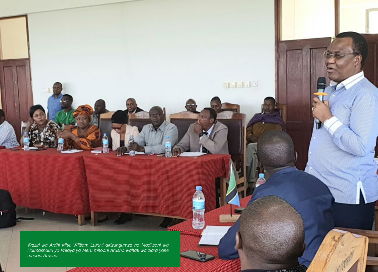
Waziri wa Ardhi Mhe. William Lukuvi akizungumza na Madiwani wa Halmashauri ya Wilaya ya Meru mkoani Arusha wakati wa ziara yake mkoani Arusha.